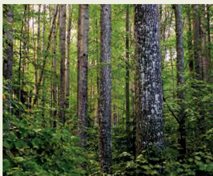
Eesti üks uhkemaid haavikuid Järvseljal.

Ajakiri ilmub Keskonnainvesteeringute Keskuse toetusel