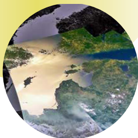
ESIKAANEL: Eesti kollaaž ESTCube'i tehtud fotodest.