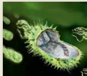
ESIKAANE FOTO: SCIENCEPHOTO / VIDA PRESS