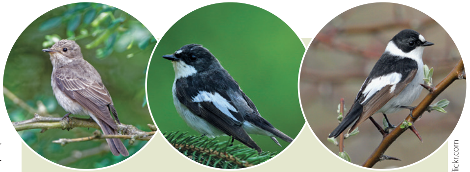
Hall-kärbsenäpi, must-kärbsenäpi ja kaelus-kärbsenäpi isaslinnud

Ehkki trükiallikate järgi teeb väike-kärbsenäpp pesa küllaltki madalale, on minu nähtud pesad olnud tublisti kõrgemal kui meeter-paar. Olen silmanud ka üht kõrgel puutüükas asuvat pesa – ka puutüükas pesitseda pole väike-kärbsenäpile kuigi omane. Pesa ehitab emaslind üksi, puuõõnsusse või tüveharude vahele. Emaslind ka muneb ja haub, justkui ehitamisest veel ei piisaks. Iga tund lahkub ta pesalt mõneks minutiks, ehkki isaslind püüab teda mõningal määral toita. Toitu vastu võttes väristab emaslind tiibu ja sirtsus manguvalt.