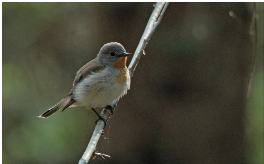
Varem kandis väike-kärbsenäpp nimetust väiketikk. Seda pisikest värvulist on kutsutud ka väikeseks kärbsenäpüüdjaks