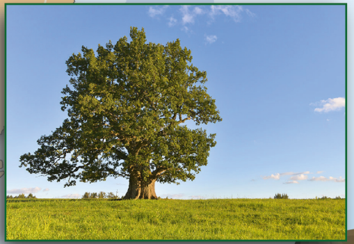
Tamme-Lauri tamm suvel, 2013. a