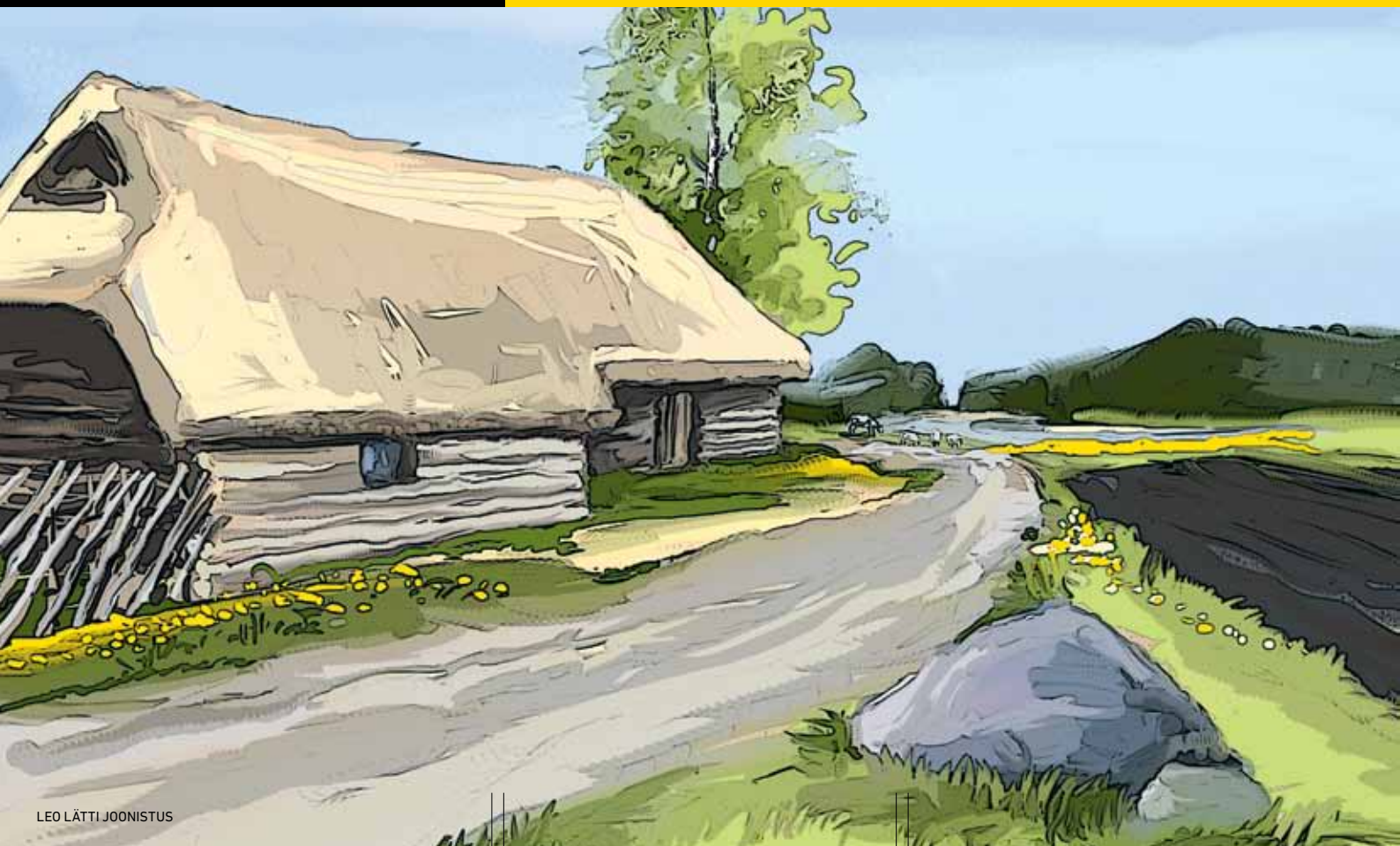
LEO LÄTTI JOONISTUS