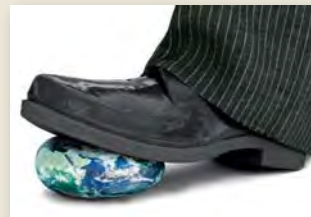
ESIKAANE FOTO: CORBIS / VIDA PRESS