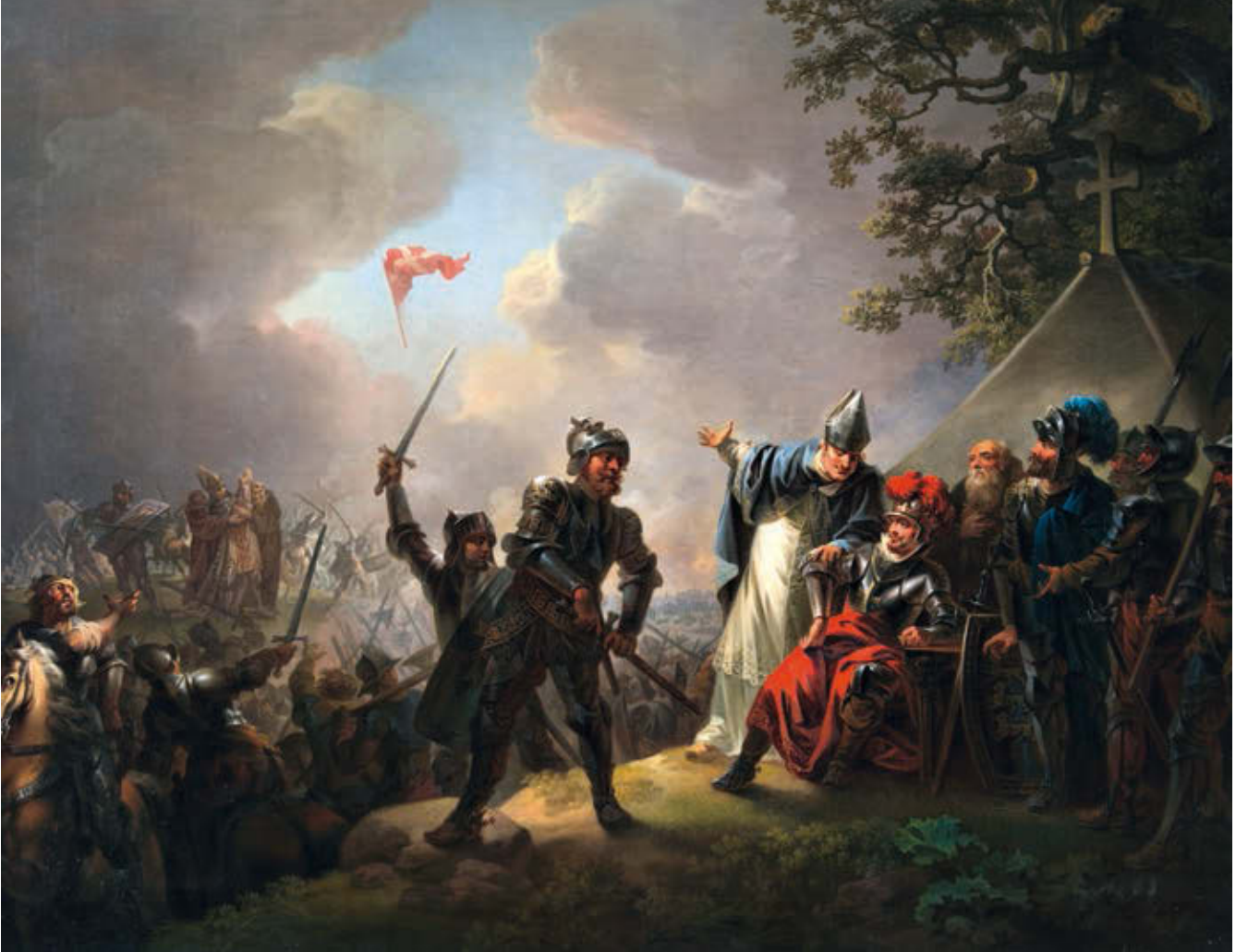
Christian August Lorentzeni maal (1809) „Dannebrog langeb taevast Lindanise lahingu ajal 15. juunil 1219“ on tuntuim Dannebroggi legendi aineiline pilt, mida on reprodutseeritud loendamatu kordi. Elava ja dramaatilise pildi eesmärk on rõhutada esiplaanile asetatud kuninga erilist rolli selles sündmuses. Tagaplaanil (pildi keskel) võib näha ka taanlaste laevastikku ja Tallinna siluetti

kaldal, praeguse Põhja-Saksamaa aladel. Vendi ristsõdade üheks pöördepunktiks loetakse Rügeni saarel asunud Arkona templi vallutamist 1168. aastal. See olevat juhtunud Püha Vituse päeval, 15. juunil, ehk samal päeval Lindanise lahinguga. Saatuse irooniana said taanlaste päästjateks Tallinna all just nendesamade vendide järeltulijad.