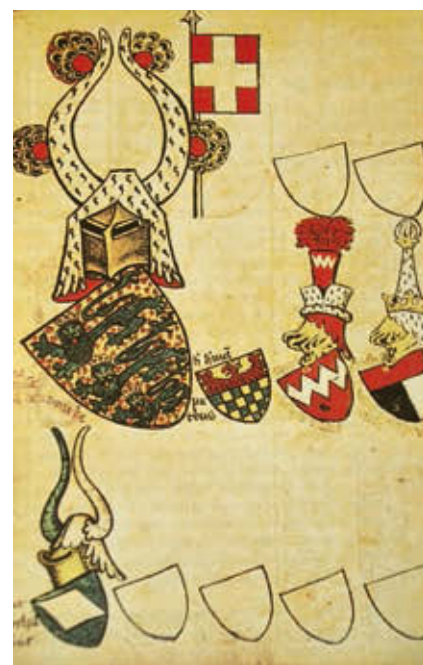
Vanim värviline kujutis Taani lipust pärineb Madalmaades aastatel 1370–1386 koostatud Gelre vapiraamatust