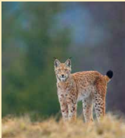
Рысь чувствует себя хозяйкой в наших лесах, человек для нее сосед, которого приходится терпеть.