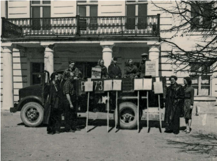
Rühm looduskaitseentusiastide Vatla mõisa ees koos looduskaitsetähistega, et paigaldada need pargi piiridele

arendab sidet laiade rahvahulkadega“ [2].