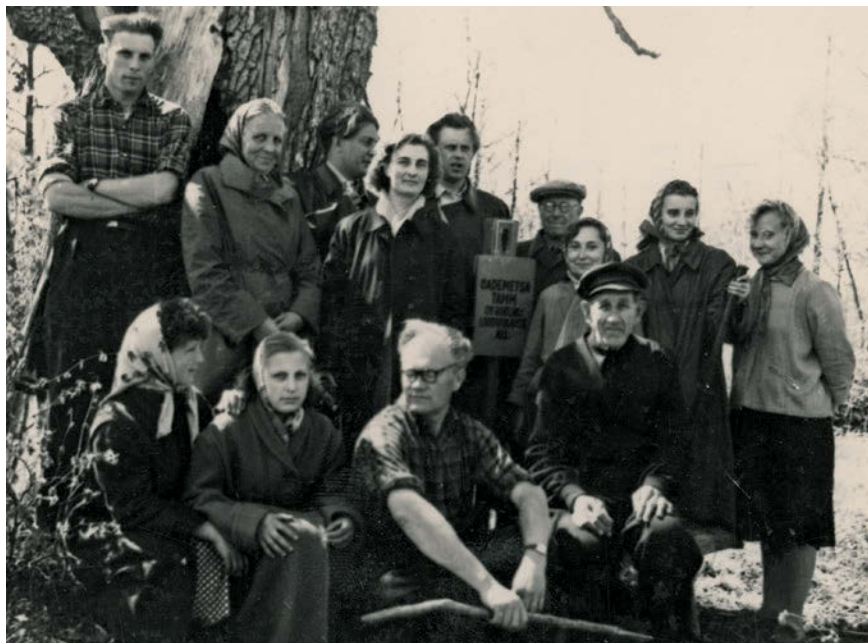
1958. aasta 10. mail tähistati Läänemaal esimest looduskaitsepäeva. Pilt on tehtud Oademetsa tamme juures