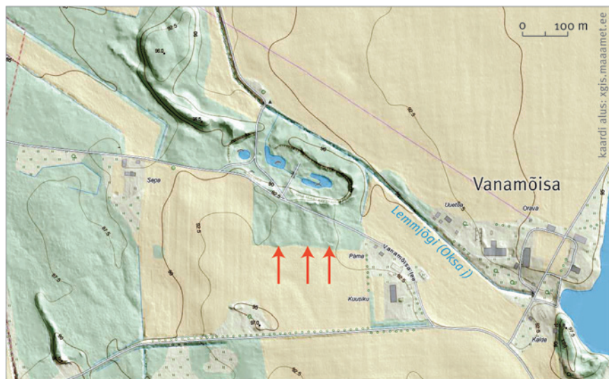
◇ 3. Üksikasjalikud LIDAR-i andmed annavad märku kolmest põhja-lõunasuunalisest kühmusest (osutatud nooltega) Vanamõisa kalmistualal pealahingupaigast põhja pool, mis praegusajal on kaetud metsa ja tiheda võsaga. Mida need suuri kääpaid meenutavad moodustised võivad peita?

Artur Vassar on oma artiklis Sakala lahingust otsesõnu küsinud: „Miks eestlased läbisid lahingupäevani sama aja jooksul üle kolme korra vähem maad kui vaenlane?“ [4]. Tõepoolest, kui ristisõdijate vägi liikus lahingupäeva ja sellele eelnenud päeva jooksul kokku umbes 40 kilomeetrit, siis eestlaste oma vaid 13–14 kilomeetrit.