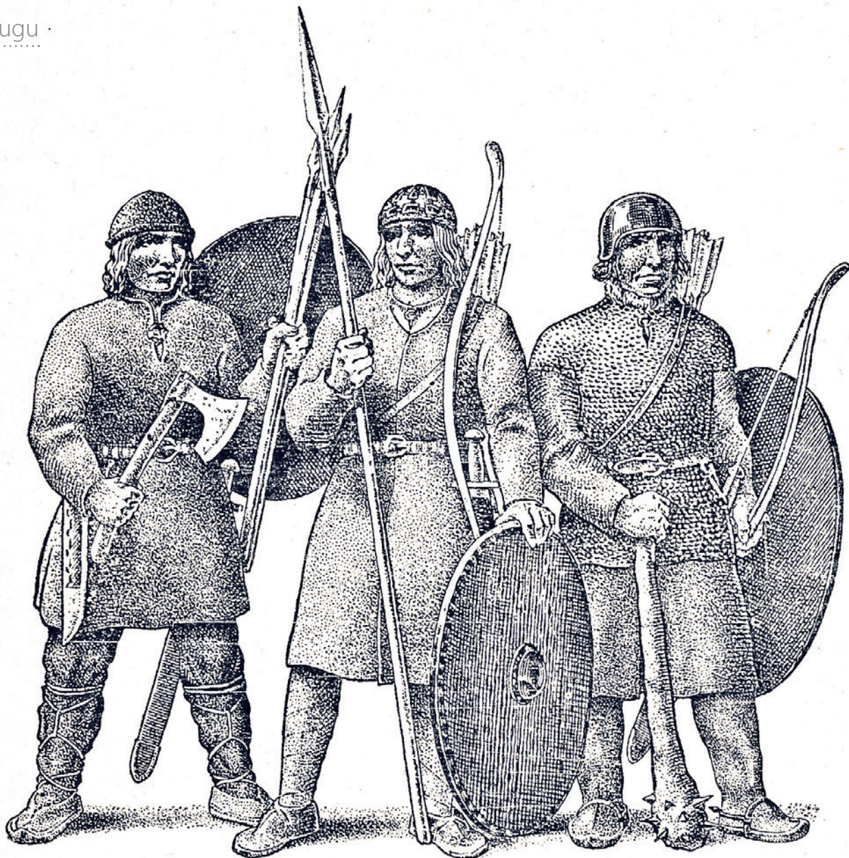
Günther Reindorffi sulejoonistus muistsetest Eesti sõjameestest