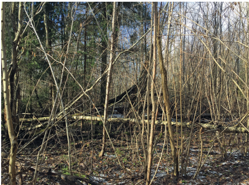
Vaade Vanamõisa kalmistualale. Kas selle võsase pinna alla on maetud tuhatkond Eesti koondmaleva sõdalast?

nii parem kui ka vasak koondmaleva tiib tõenäoliselt taganema. Koos Sakala malevaga taandus arvatavasti pealahinguväljalt loode suunas ka koondmaleva väepealik Lembitu. Lätlased ajasid neid taga. Henriku Liivimaa kroonikas on selle episoodi kohta konkreetne märkus: „Ja Veko, Roboami vend, tundis Lembitu ära ja ajas teda taga ja tappis ta ... Ja langesid seal ka teised Sakala vanemad, Wottele, Maniwalde koos õige paljude teistega“ [3: 181].