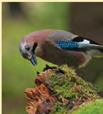
Сойка – самая обычная для Эстонии птица, предпочитает ельники, по осени лакомится в дубравах желудями.