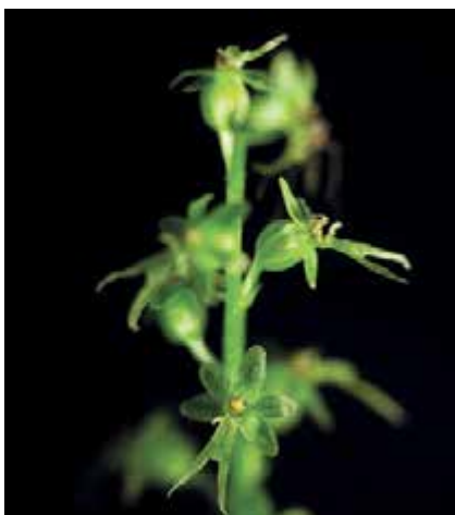
Vanemates varjukamates metsades võib suvesoojuse süvenedes kokku juhtuda muu hulgas väikese käöpõllega

nendevahelised turvastuvad veerohked orud. Kurgja metsades hakkab silma ka püstiste surnud puude hulk, mis sugugi ei peaks tekitama vaatlejas õudu, vaid hoopis rõõmu, kuna pakub ohtralt elupaiku mitmekesisele metsaelustikule.