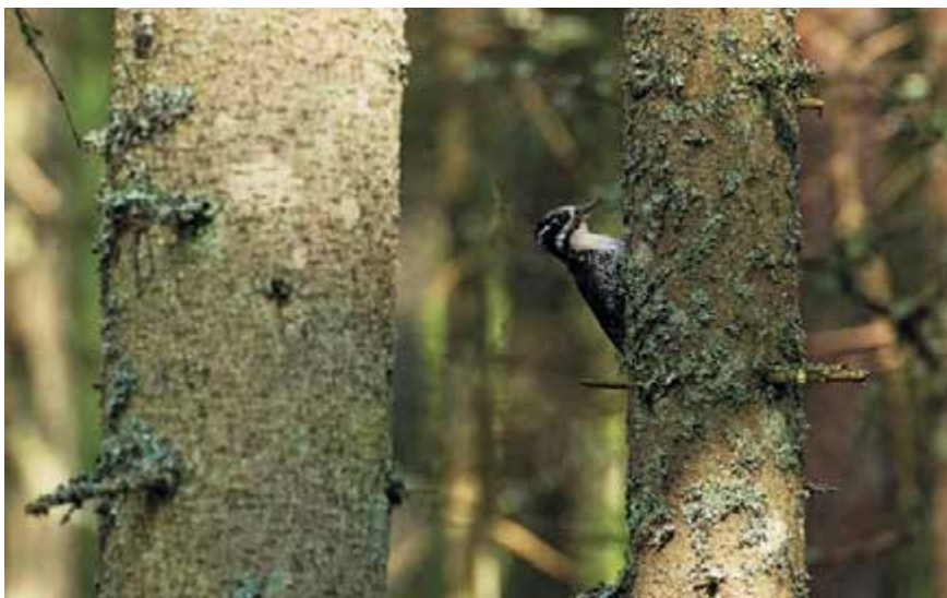
Õne korral võib mõnel tuulevaiksel päeval kuulda toksimas laanerähne. Möödunud aastal pesitses Kurgjal neid puuseppasid suisa mitu paari