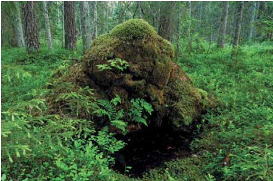
Ümberkukkunud puud ja nende väljarebitud juurtest jäänud augud tekitavad ajapikku mikromaastiku veelokkude ja küngastega