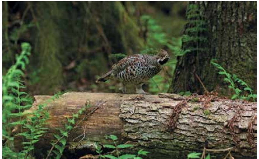
Kurgja küla metsades elab hajusalt suisa mituteist paari laanepüüsid, kes metsas liikujat aeg-ajalt ehmatavad

võib askeldamas näha kõiki meie tiivulisi puuseppasid – rähnlasi, välja arvatud roherähni ja tamme-kirjurähni.