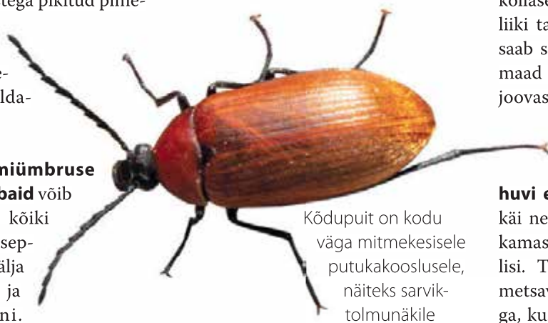
Kõdupuit on kodu väga mitmekesisele putukakooslusele, näiteks sarvik- tolmunäkile

ja mis seal salata – ma ei käi neis puistutes mitte üksnes puhkamas, vaid ka lootes kohata tiivulisi. Tegemist on Vahe-Eesti põlise metsavõõndi kõige kitsama metsaalaga, kus veel tänapäevalgi elab ohtralt