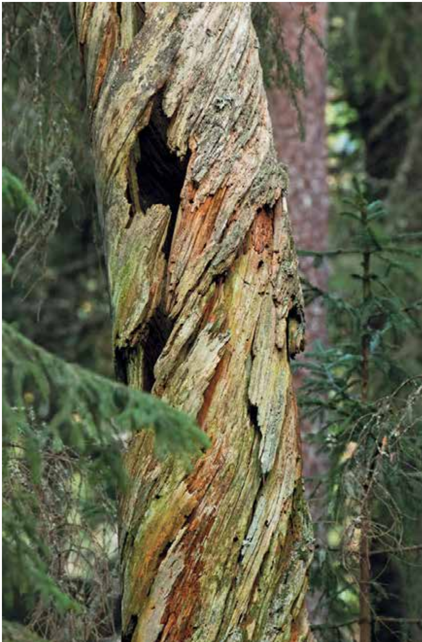
Kurgjal leidub hulgaliselt surnud, kuid endiselt püstiseid puid, mis pakuvad elupaika paljudele

metsiseid. Neid suuri kanalisi muidugi naljalt ei kohta, isegi kui veeta kõnealustes metsades aega varajasest hommikutundidest kuni hetkeni, mil päikeseketas viimaseid puulatvu apelsinikarva maalib. Ma olen tähele pannud, et tihtipeale ootavad mõtused viimase viivuni mõne mustikapuhma või kuusehakatise varjus, et ohu korral tiibade vuhinal mööda tiheda alusmetsaga puistut kaugustesse pageda.