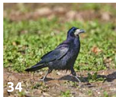
Arne Adler / loodusemees.ee