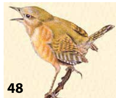
Joonis: Reet Rea