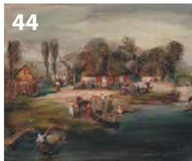
Maal: Enn Kuni kunstikollektsioon